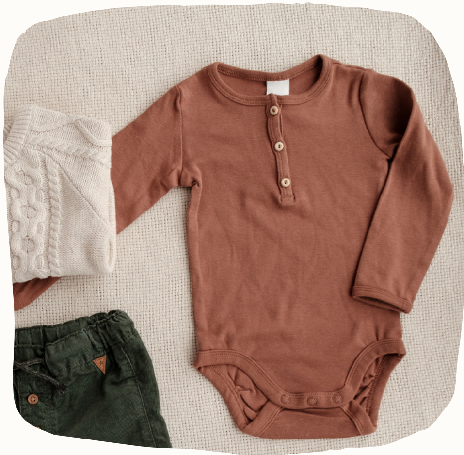
Բոդի. արժեքը սկսվում է՝ 3500 դրամից

Ստորև ներկայացված են ամենաշատ գնվող ապրանքները.