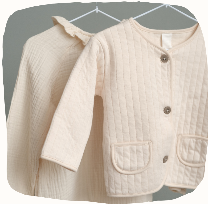
Բարակ բաճկոններ կամ սվիտերներ. արժեքը սկսում է 5700 դրամից.