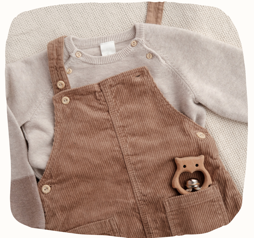
Սեթ. արժեքը՝ 9000 դրամ